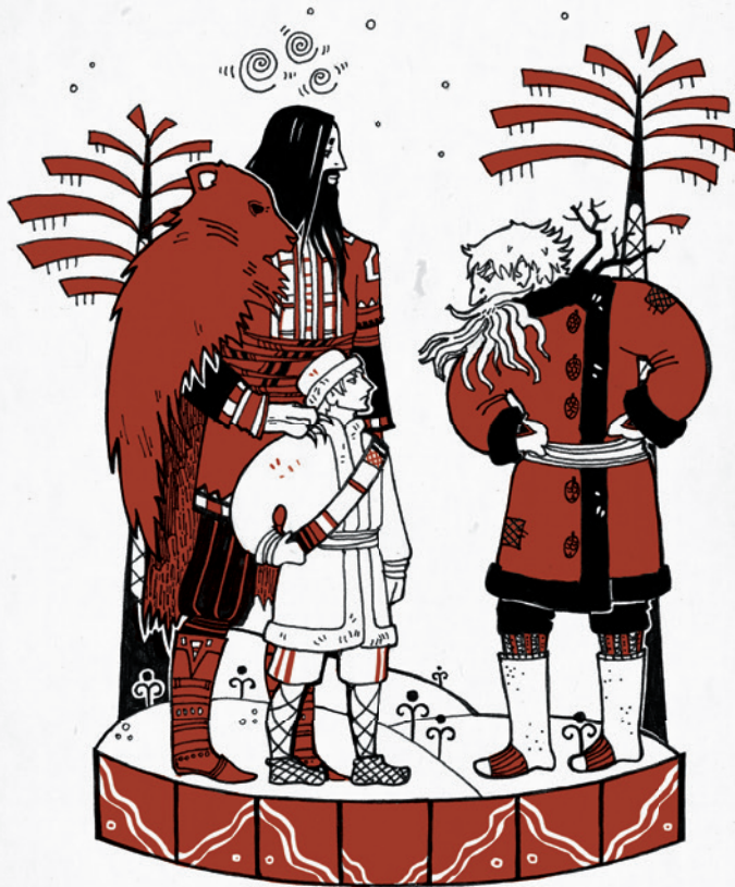
ВЕЛЕС, ПОГЛЯД И ЛЕШИЙ

— Мало ль нужно чего, да не для чего, — недовольно пробурчал Леший, но полез за пазуху, достал кисет, стянутый шнурком, и протянул Погляду: — Полное ведро накипяти, высыпь всё, отставь от огня. Остынет, станет как тёплое парное молоко, тогда можно пить. Один глоток! На завтра не оставляй, в день всех обойди, по глотку давай. Остаток вынеси за околицу, под засохшее дерево вылей. Кисет потом отдашь, как встретимся. Всё, я пошёл, всем живе и здраве.